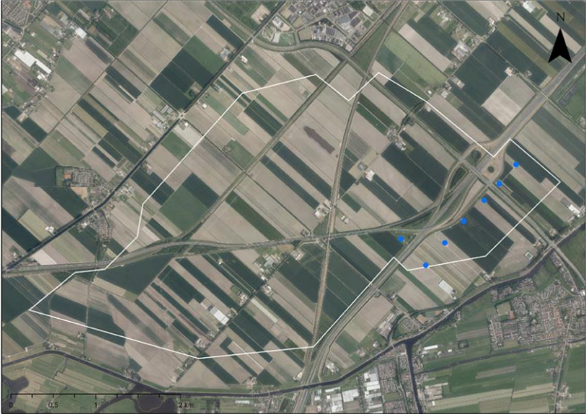
Scenario 1 Huidig